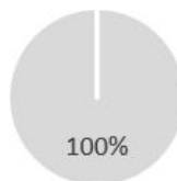
2. Afstemming beleggingen op taxonomie exclusief staatsobligaties*