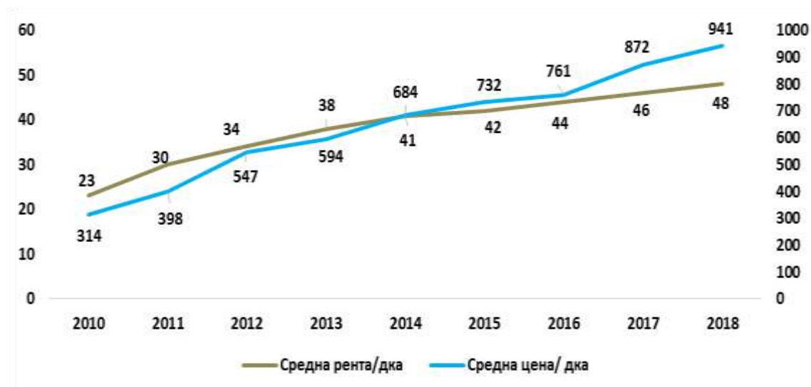
Фигура 1: Движение в цената и рентата на декар от 2010 до 2018 г.

Докато големите инвеститори в земя под формата на фондове участват на пазара със спекулативна цел – покупка на земя докато все още цената е ниска и продажбата ѝ като поскъпне, през последните пет години взе по-активни в придобиването на земя са самите земеделски стопани. Още повече, че цената на земеделската земя и нивата на рентите се увеличиха повече от два пъти за последните 10 години.