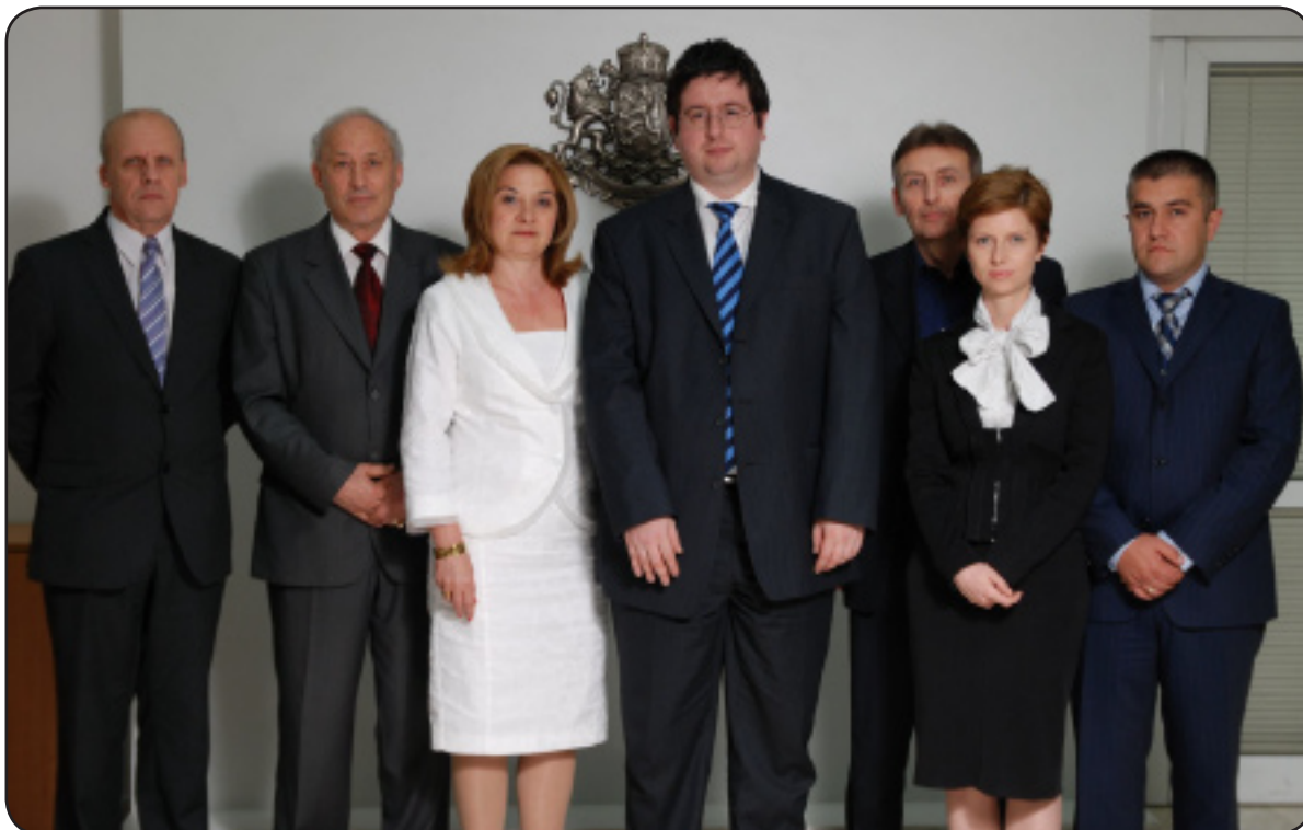
Новият ръководен състав на Комисията за финансов надзор

Министър на правосъдието: Миглена Тачева