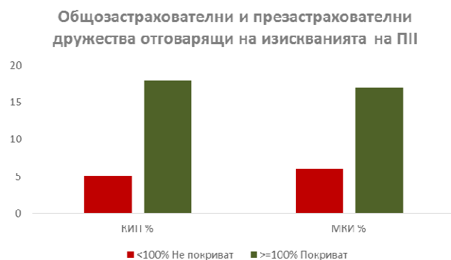
Графика 1 – Общозастрахователни и презастрахователни дружества, които покриват или не покриват пруденциалните съотношения по Платежоспособност

Общозастрахователните и презастрахователните дружества, които попадат в обхвата на Платежоспособност II, наброяват 23.